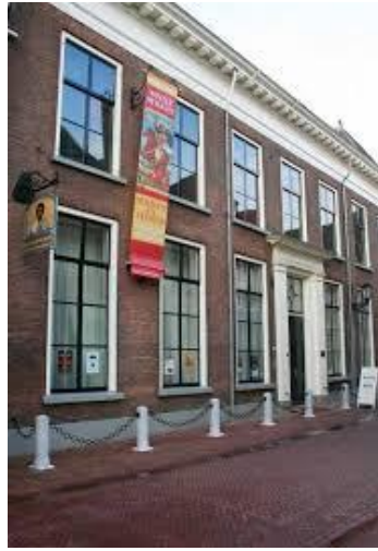
Fig 7.2 Iconenmuseum