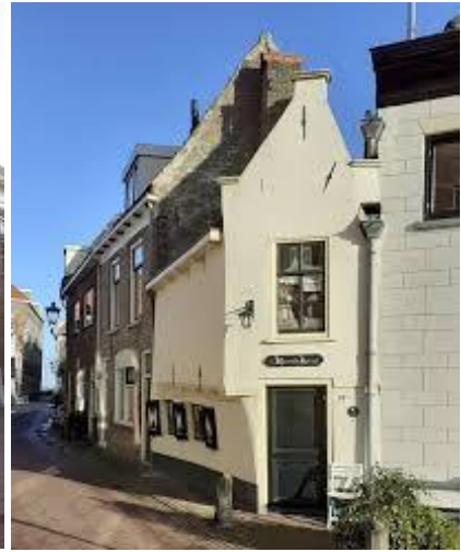
Fig 7.3 Kleinste huisje van Kampen