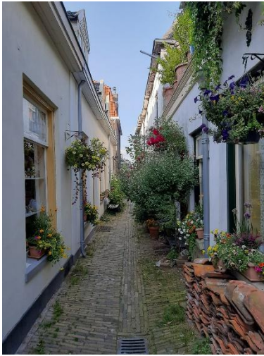
Fig 7.1 Schapensteek Kampen Foto's FvD – juli 2024